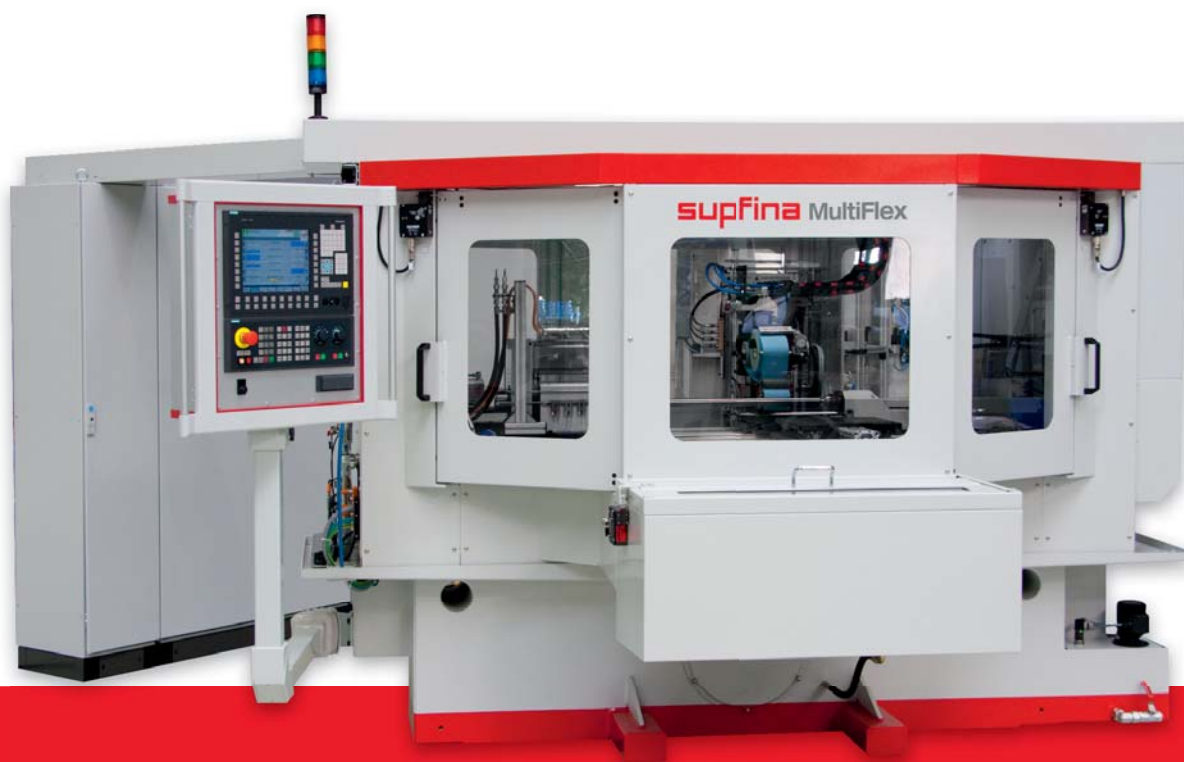
Supfina 722/1 MultiFlex avec un système à palette

Diamètre de la vis à billes : max. \varnothing 35mm